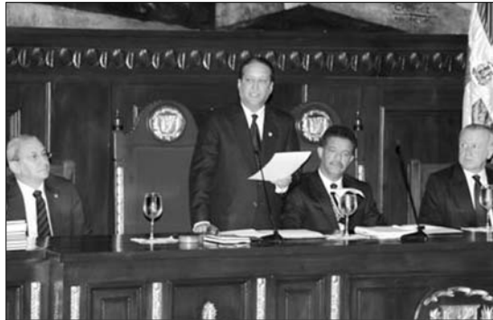
Reinaldo Pared Pérez

Señoras y Señores: Al conmemorar el 164 aniversario del nacimiento de la República Dominicana, el Senado y la Cámara de Diputados, sesionando en el día de hoy en reunión conjunta en esta solemne sala, le acogemos complacidos Señor Presidente, en este estelar momento de la vida democrática e institucional de la nación, y de esta forma cumplir, con las disposiciones contenidas en el artículo 29 de nuestra Constitución, según las cuales en esta fecha debemos